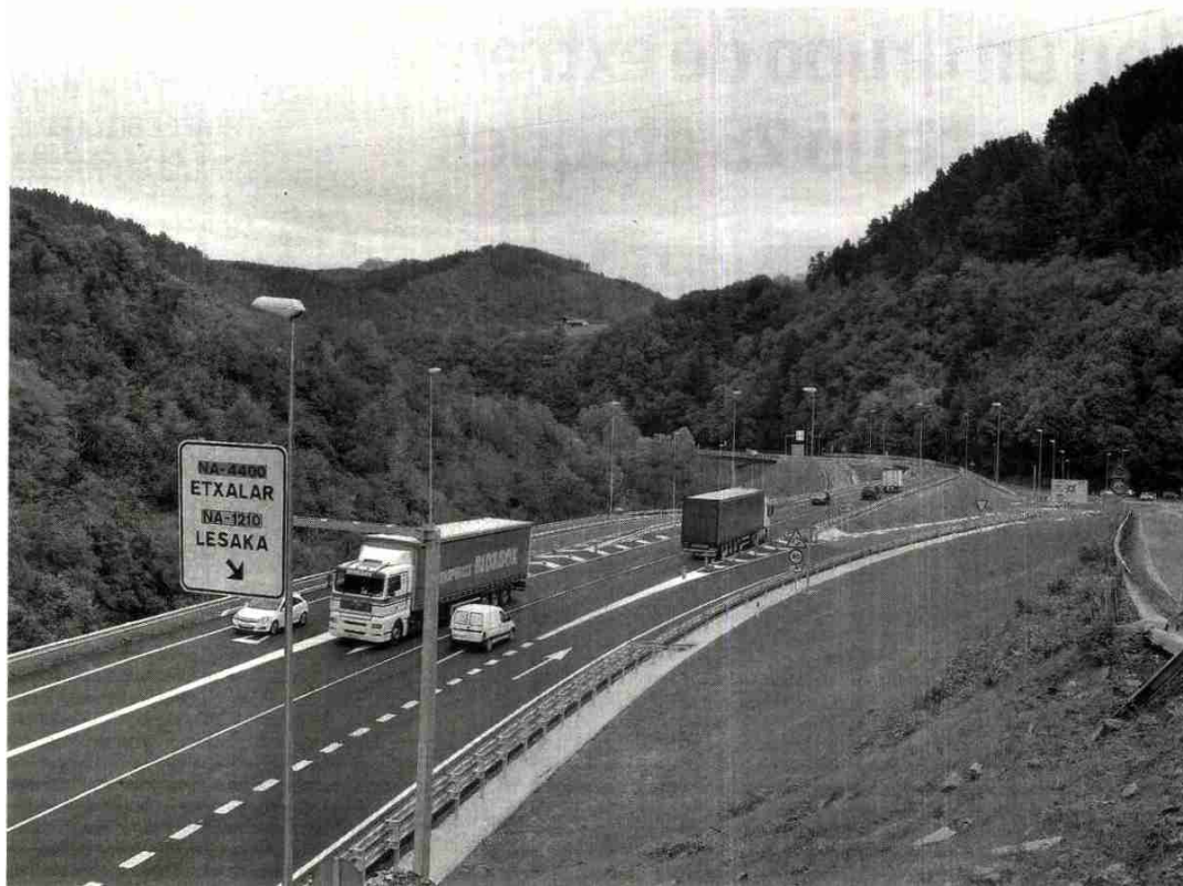
Aspecto del acceso a Etxalar y Lesaka de la nueva carretera inaugurada ayer.